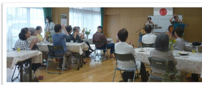
ギターに合わせて皆で手拍子♪

今回はアクリル毛糸で環境にも配慮したエコなたわしを作る予定です。自宅で使うもよし、ラッピングしてプレゼントするもよしですね。皆さまのご参加をお待ちしています♪